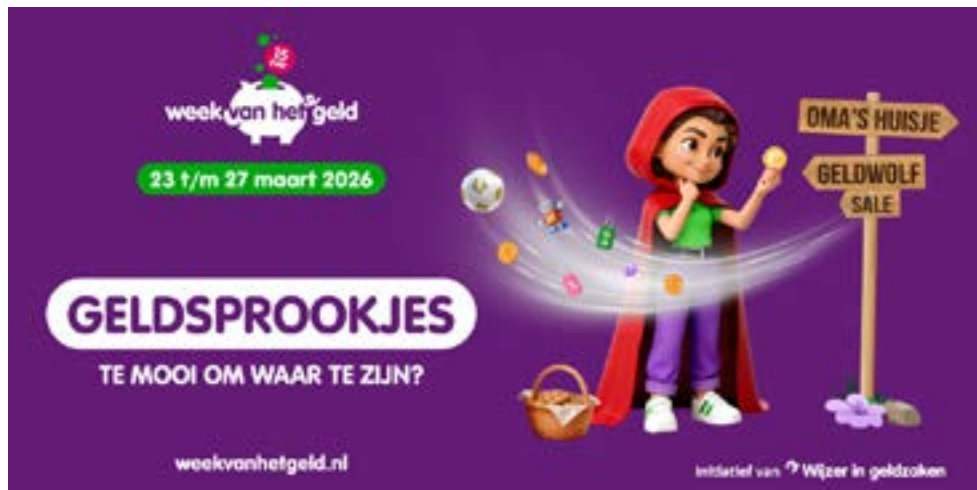
Roodkapje twijfelt of ze naar oma gaat of kiest voor de sale. Geldsprookjes zijn vaak te mooi om waar te zijn.

Kijk voor meer informatie en een overzicht van alle activiteiten op www.weekvanhetgeld.nl .