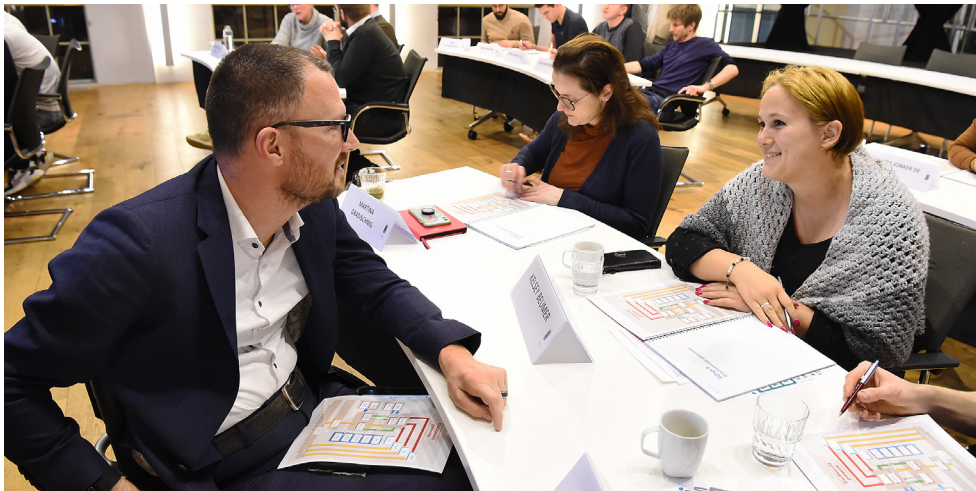
Deelnemers aan de cursus Politiek Actief van afgelopen woensdag.

Alle contactgegevens vindt u op de website van de gemeenteraad https://raad.oude-ijsselstreek.nl