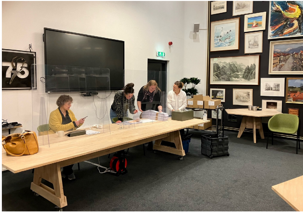
Het stembureau in het gemeentehuis in Gendringen.

In de tabellen hiernaast ziet u de uitslag van de Tweede Kamerverkiezing 2023 in Oude IJsselstreek in percentages. Er is hierbij een vergelijking gemaakt met de Tweede Kamerverkiezing in 2021.