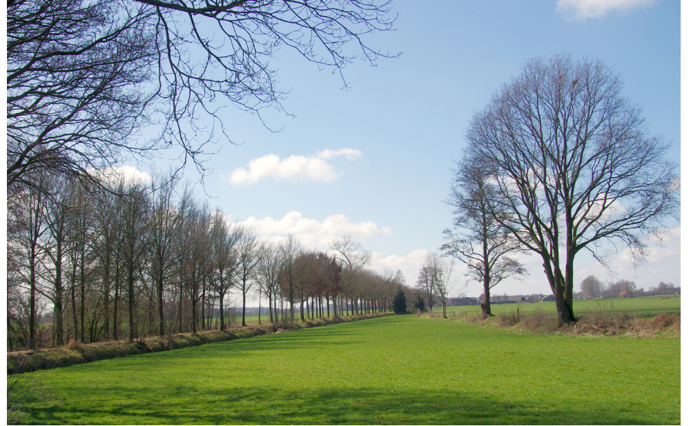
In het 'Uitnodigingskader wonen buitengebied' zijn nieuwe en ruimere mogelijkheden opgenomen voor ontwikkeling van woningbouw in het buitengebied, in ruil voor sloop van gebouwen die vrijkomen in combinatie met inpassing van de plannen in het landschap.

gesloopt worden, maar er kunnen ook landschapselementen of natuur worden aangelegd. Dit alles kan punten opleveren, de zogenaamde 'ontwikkelruimte'. Deze 'ontwikkelruimte' kan worden ingezet voor de bouw van nieuwe woningen, maar ook voor bijvoorbeeld het toestaan van meer bijgebouwen bij een bestaande woning.