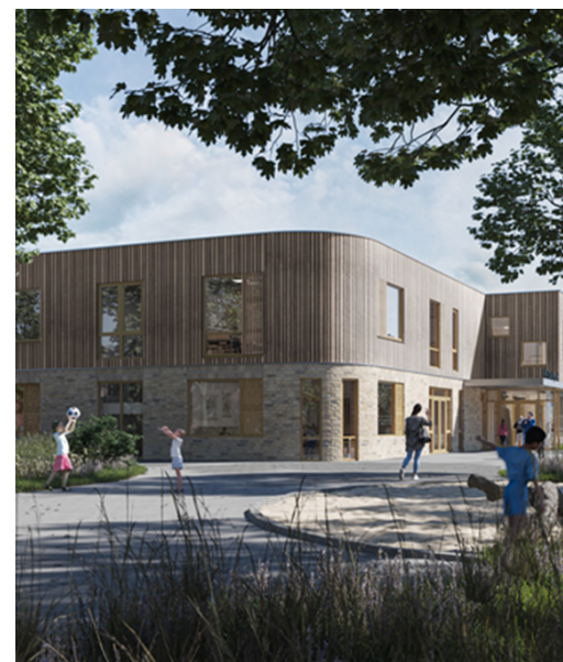
Een impressie van het nieuw te bouwen IKC De Wijssel.