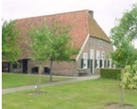
Het Hofshuus in Varsseveld

Het gemeentebestuur van Oude IJsselstreek nodigt u van harte uit voor de zomerreceptie op vrijdag 22 september van 16.00 tot 18.00 uur bij Museumboerderij Het Hofshuus, Leemscherweg 24 in Varsseveld.