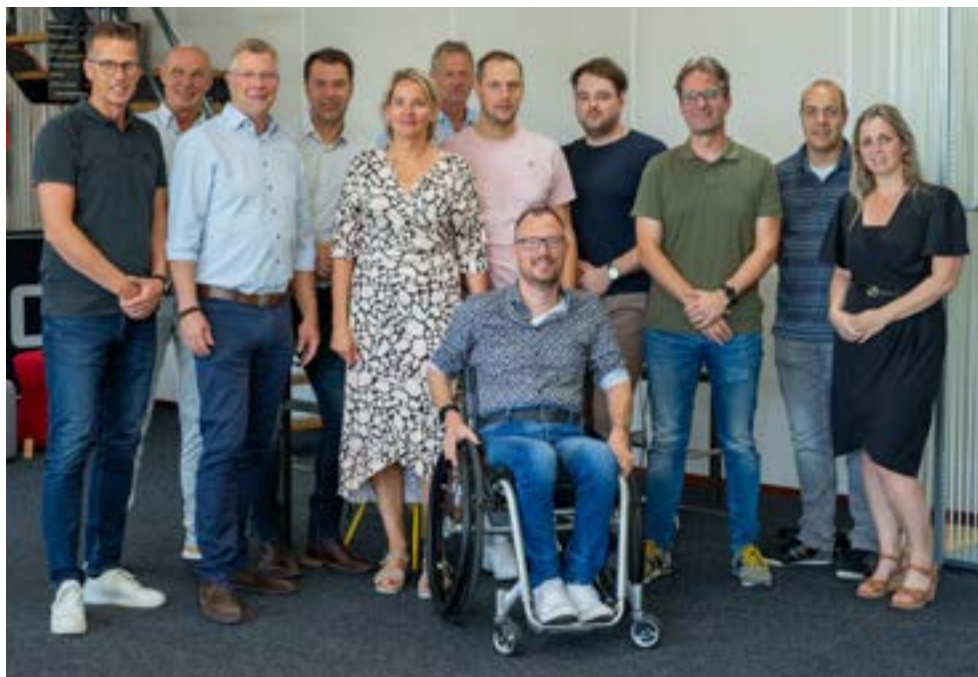
Het college met de directie van de Terborgse HandelsOnderneming.

veel aandacht voor duurzaamheid, heeft het bedrijf alle onderdelen van het opknappen van kantoormeubilair onder één dak gebracht. Reden voor het college om een bezoek te brengen aan het opvallende pand langs de Oude IJssel in Terborg. Meer informatie over dit bedrijfsbezoek leest u op www.oude-ijsselstreek.nl (onder 'nieuws').