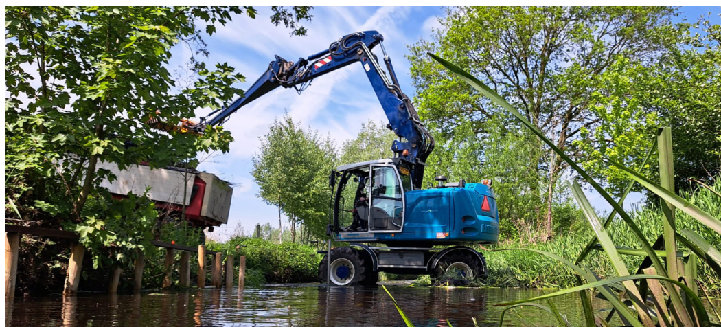
Een voorbeeld van baggerwerkzaamheden zoals ze ook in onze gemeente zullen worden uitgevoerd.

Begin juli gaat Waterschap Rijn en IJssel baggeren in de vijver aan de Touwslagersbaan in Gendringen. Door de jaren heen is deze vijver door zand te ondiep geworden en heeft de beek bladresten en andere planten meegevoerd. Er ontstaat zo te veel plantengroei. Medewerkers van het waterschap kunnen hierdoor hun normale onderhoudswerk niet goed meer doen. Ook wordt de kwaliteit van het water minder. Vóórdat het baggeren begint, worden de