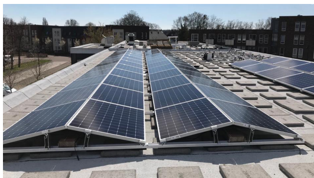
Zonnepanelen op het dak van het Frank Daamenpand

Er is in totaal ongeveer 163 hectare aan groot dakoppervlak in Oude IJsselstreek, waarvan 75 hectare echt geschikt is voor zonnepanelen. Sommige daken zijn namelijk niet sterk genoeg. Verder moeten