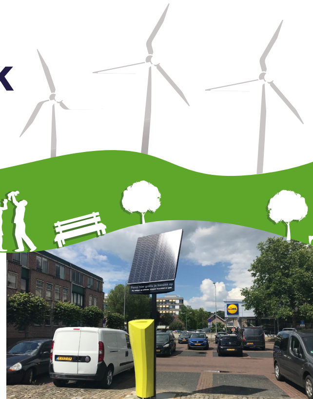
De 'slimme bandenpomp' in Terborg.

Heeft u een groot dak, en wilt u daarop zonnepanelen leggen? Kijk dan eens op de website van Zonnige Bedrijven Achterhoek: www.agem.nl/zonnigebedrijven .