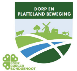
Tanja te Pas, Fractieassistent DorpEn Platteland Beweging