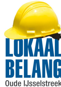
Jaap Veldhorst, Raadslid Lokaal Belang