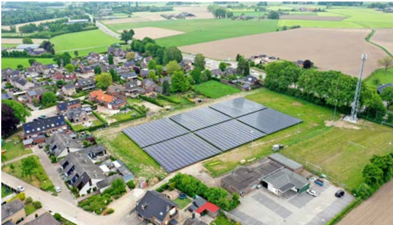
Luchtfoto Zonnepark Braamt tijdens aanbouw

De 8 Achterhoekse gemeenten doen al 5 jaar iets unieks: gezamenlijk hebben we ons eigen energiebedrijf: AGE (Agem Gemeentelijke Energie). Daarmee leveren we energie aan onszelf. We wekken eigen stroom op en kopen het zelfstandig en rechtstreeks in, zonder tussenkomst van energieleveranciers. Het is 5 jaar geleden gestart met het leggen van zonnepanelen op de daken van de eigen gemeentehuizen. Inmiddels hebben we als gemeenten ook een eigen zonneveld in Braamt. Zo leveren we als gemeenten voor een deel stroom aan onszelf, zijn we minder afhankelijk van de elektriciteitsmarkt en is de stroom over het algemeen ook goedkoper.