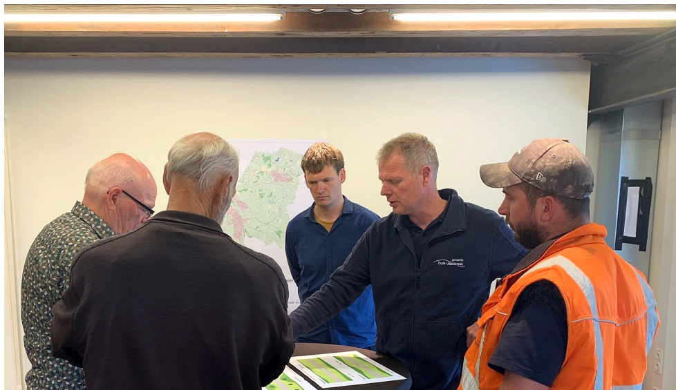
Medewerkers van de gemeente geven uitleg en vertellen hoe het maaibeleid bijdraagt aan de toename van biodiversiteit.

Meer informatie vindt u op www.oude-ijsselstreek.nl/bermbeheer