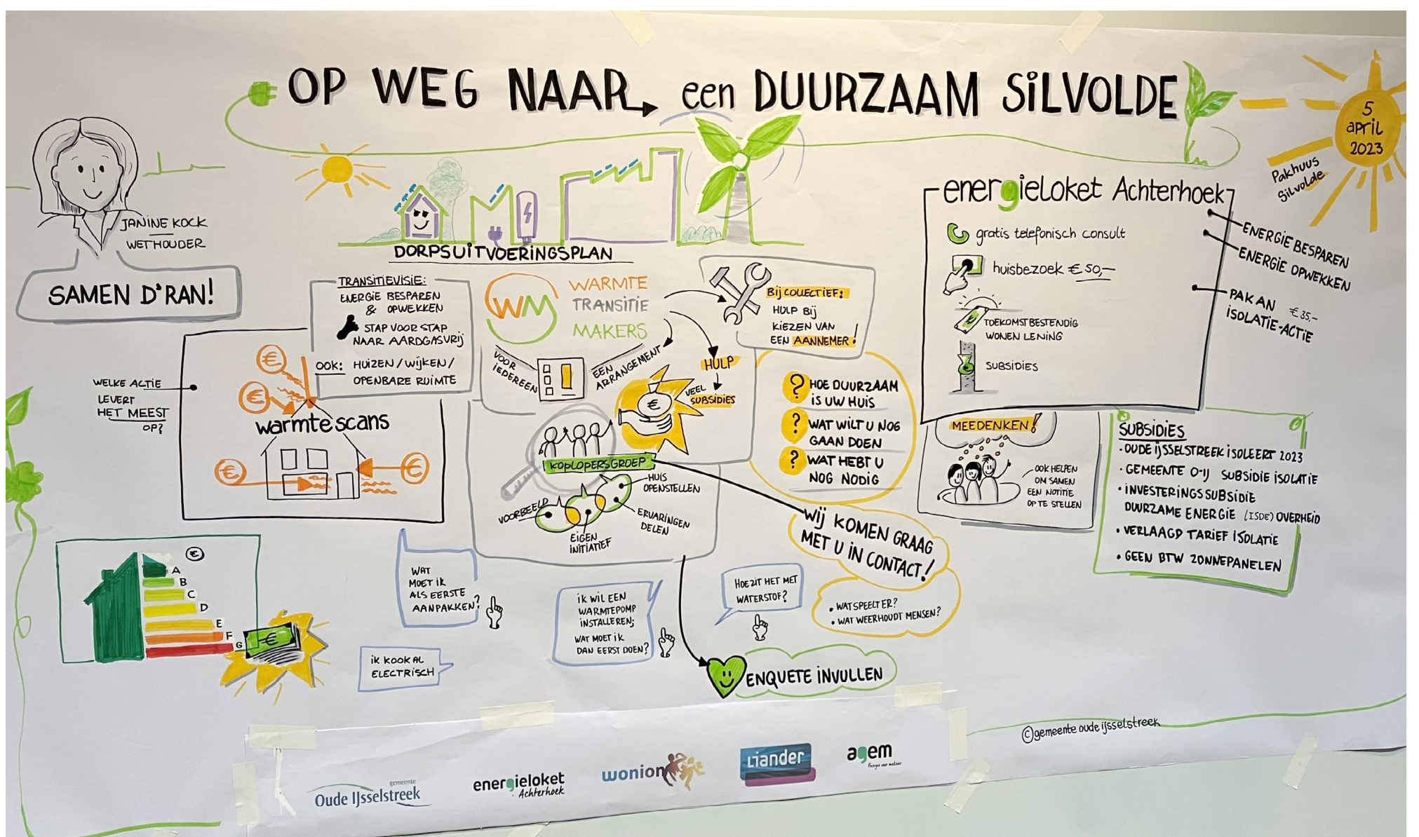
Van de bijeenkomsten in Varsseveld en Silvolde is ter plekke een beeldverslag gemaakt.