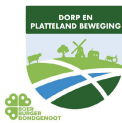
Gerrit Vossers – Raadslid DorpEn Platteland Beweging