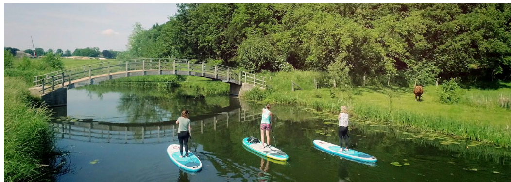
Oude IJsselstreek heeft op recreatief gebied veel te bieden.

Ondernemers in de (toeristische) verblijfsrecreatie binnen de regio Achterhoek die hun aanbod willen verbeteren, lopen vaak tegen grote uitdagingen aan. Een regionaal programmateam is nu actief om ondernemers te stimuleren tot en te ondersteunen bij nieuwe initiatieven om zo de verblijfsrecreatie in de Achterhoek verder te versterken en te verbeteren.