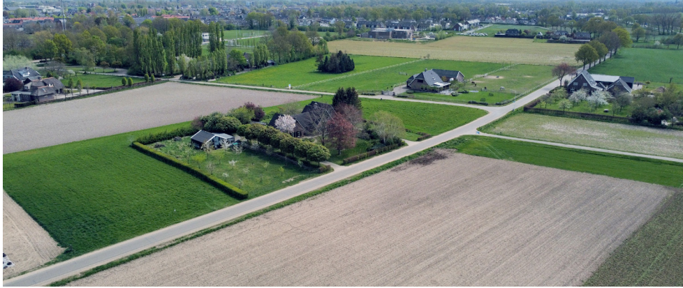
Het projectgebied Biezenakker gezien vanuit de lucht.