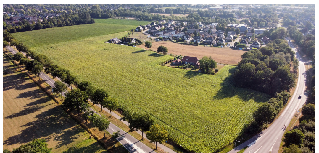
Het projectgebied Lenteleven gezien vanuit de lucht. Op de volgende pagina ziet u een foto van het projectgebied Biezenakker.

Op dit moment voeren we diverse onderzoeken uit naar de structuur en onder- en achtergrond van het zoekgebied. Welke flora en fauna treffen we aan? Wat is de historie van het gebied? Hoe is de waterhuishouding, welke delen zijn natte gebieden en welke delen hebben de kenmerkende zandgronden? Welke functies zijn er in het gebied en in de directe omgeving aanwezig die invloed hebben op de inrichting van het gebied? Hoeveel verkeer zit er op de omliggende wegen en wat zijn de gevolgen daarop als we een nieuwe wijk ontwikkelen? De projectgroep verzamelt de uitkomsten